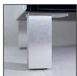
Möbelfüße MF 10