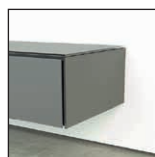
Wandhalterung WA 10