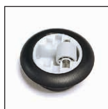
Möbelrollen MR 10